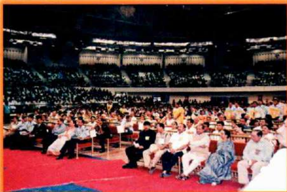
A panoramic view of the audience at The 34th Annual Convocation.